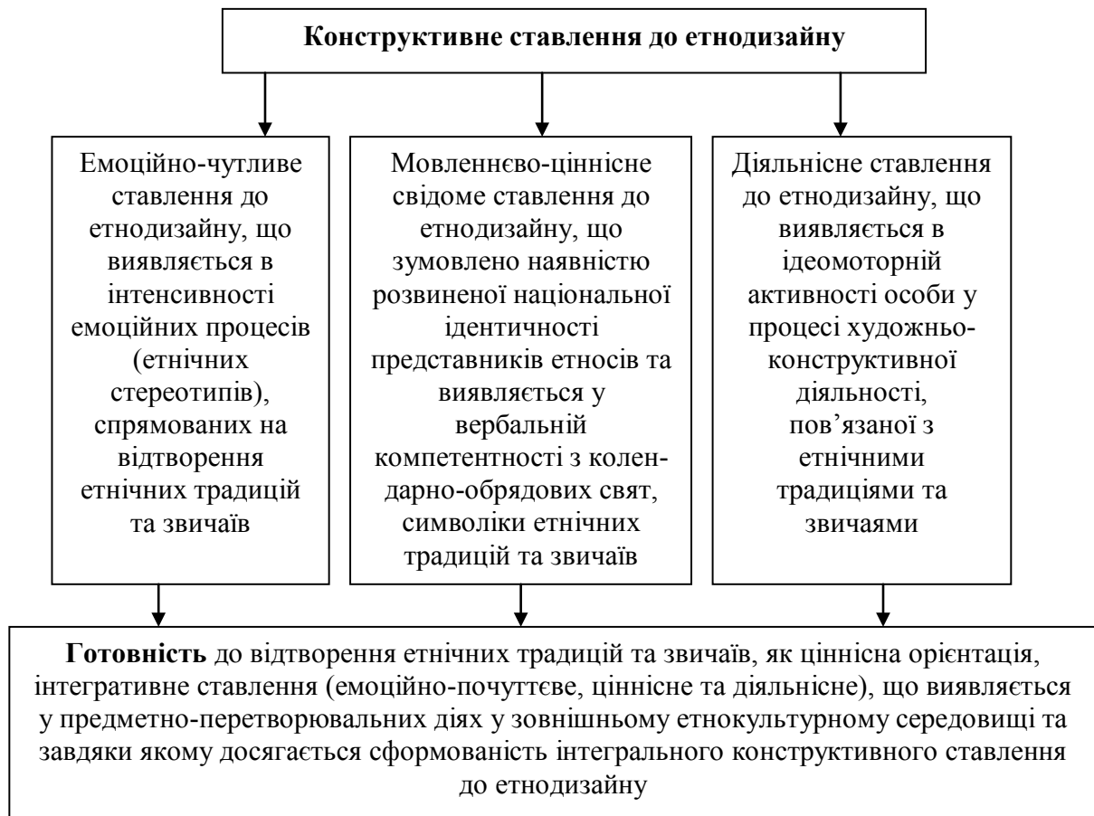
Рис. 2. Конструктивне ставлення особистості до етнодизайну

Необхідно розробити педагогічно доцільне середовище для ефективного навчання етнодизайну та педагогічної діагностики у студентів рівня розвитку їхніх здібностей до художнього проектування предметного довкілля в етнічному стилі. Це важливо знати для дизайнерів, які обрали етнодизайн як особистісно-ціннісний напрям архітектонічної творчості. Метою їхньої творчої діяльності має стати перетворення предметного середовища відповідно до національних культурних зразків і традицій. Наявність основ світогляду, зумовлених етнокультурним предметним середовищем, забезпечує базу для швидкого та адекватного взаєморозуміння осіб різних етносів. На індивідуальному рівні це сприяє самоідентифікації людини, тобто допомагає визначити соціальну групу, до якої вона належить, оцінювати власний спосіб життя, контролювати його структуру та спрямованість.