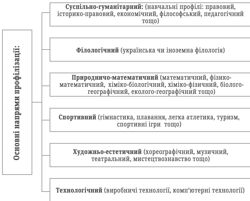
Рис. 1. Основні напрями профілізації в старших класах середньої загальноосвітньої школи.

У своїй структурі профільне навчання в старших класах середньої загальноосвітньої школи має основні напрями профілізації (див. рис. 1).