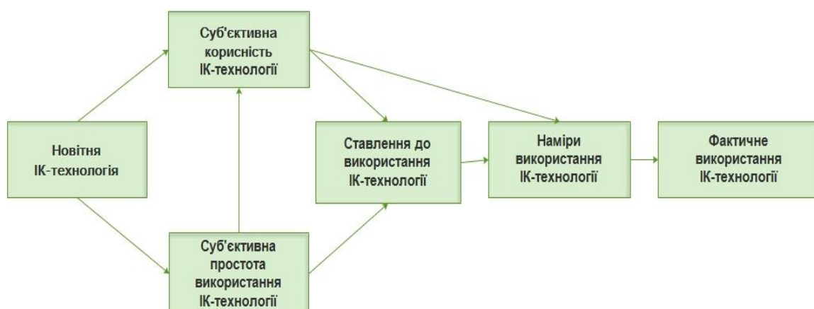
Рис. 4. Модель сприйняття ІК-технології педагогами (за Ф. Девісом)

Розглянемо «Модель сприйняття технології» Фреда Девіса (від англ. Technology Acceptance Model, (TAM)) як методику оцінювання ефективності використання інноваційної ІК-технології (Davis, 1989) (рис. 4).