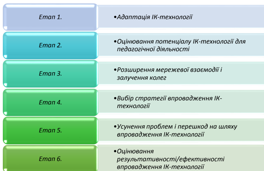
Рис. 3. Процедурна модель впровадження ІК-технологій в освітній процес

Розглянемо процедурну модель впровадження ІК-технологій за якою можна впроваджувати СКМод в освітній процес, що дозволить забезпечити якісні перетворення процесу вивчення природничо-математичних предметів (Литвинова, 2016) (рис. 3).