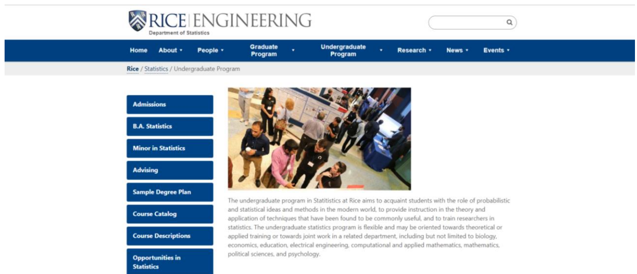
Рис. 3 Сторінка Відділу статистики Університет Райса

Австралійський Королівський технологічний інститут Мельбурна (RMIT University) здійснює підготовку бакалаврів статистики, що передбачає ґрунтовне поглиблене вивчення основ математики та статистики, практичне моделювання, аналіз та дизайн статистичних експериментів. Провідними дисциплінами у підготовці майбутніх бакалаврів статистики є теорія ймовірності та статистика, математичне числення, дослідження ринку, системне моделювання, ділові фінанси та прогнозування.