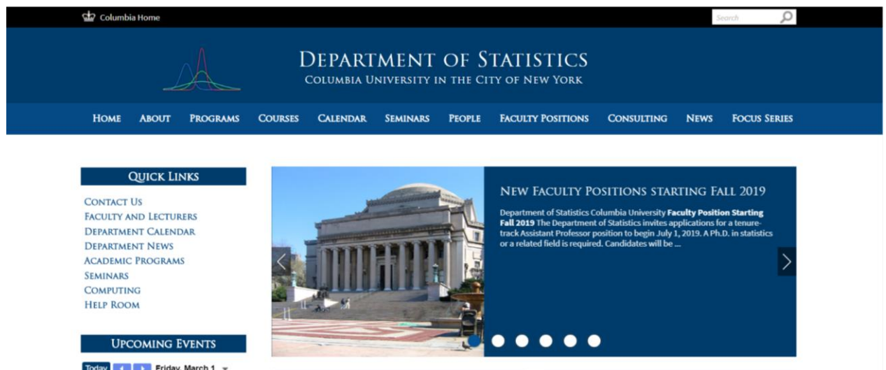
Рис. 2 Головна сторінка Відділу статистики Колумбійського університету

Вступний курс передбачає оволодіння предметами як лінійна алгебра, диференціальне та інтегральне числення з однією змінною. Основні курси базуються на вивченні інформатики, обчислювальної техніки, програмування в Matlab, прикладні статистичні обчислення, та програмування на Java. Щодо курсу статистики, то він охоплює вивчення теорії ймовірності, моделі лінійної регресії, статистичні обчислення, елементарні стохастичні процеси [7].