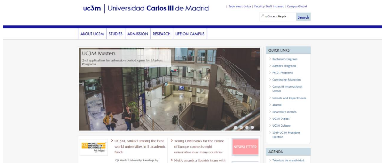
Рис. 1 Головна сторінка Universidad Carlos III de Madrid

В межах програми передбачено вивчення принципів економіки, бухгалтерського обліку, маркетингу, фінансової економіки та менеджменту, а також поглиблене вивчення інформатики (програмування, робота з базами даних) та математичних дисциплін.