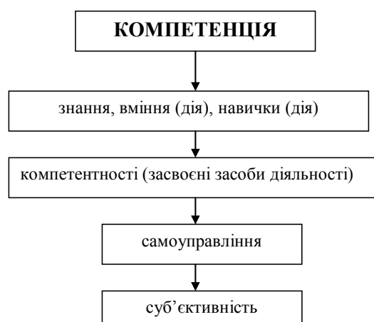
Рис. 1. Компетенція та компетентність

Порівняно з перерахованими результатами освіти, компетенція : а) є інтегрованою; б) виявляється ситуативно; в) існує як потенціал, що добудовується до конкретного змісту та виявляється у конкретній ситуації. Компетентність : а) є інтегрованою; б) на відміну від елемента функціональної грамотності дає змогу розв'язувати певний клас задач; в) на відміну від навичок, є свідомою; г) на відміну від уміння, є переносною (пов'язана з класом предметів діяння), вдосконалюється не завдяки автоматизації та перетворенню, а за допомогою інтеграції з іншими компетентностями: через свідомість діяльності нарощується компетенція, а засіб дії вміщується в базу внутрішніх ресурсів; д) на відміну від знання, існує у формі діяльності (реальної або розумової), а не інформації про неї (рис. 1).