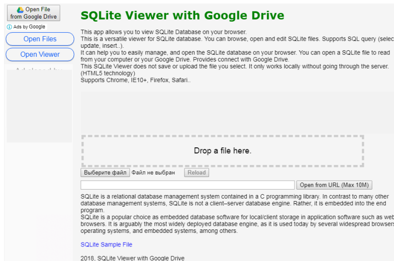
Рис. 1. Хмарний сервіс SQLite Viwer with Google Drive

Для формування ХОС необхідно здійснити доцільний вибір хмарних сервісів, які можливо використовувати у навчанні баз даних майбутніх учителів інформатики. Нами були розглянуті хмаро орієнтованої системи дистанційного навчання (ХОСДН) та сервіси навчання БД. З метою обґрунтування вибору доцільних сервісів визначені такі критерії їх добору, а саме: для ХОСДН – організаційно-дидактичний, комунікаційний та функціональний; для навчання БД – функціонально-дидактичний та організаційний. В результаті обрано ХОСДН Canvas та SQLite Viwer with Google Drive, що є зручними сервісами для розв’язування навчальних завдань з дисципліни «Бази даних» (рис. 1).