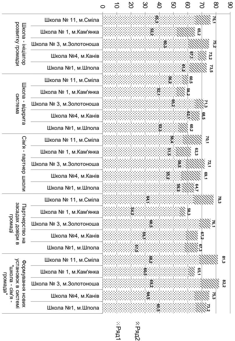
Рис. 2. Результати формування довіри в Школі громадської довіри – вектора власного розвитку та розвитку громади