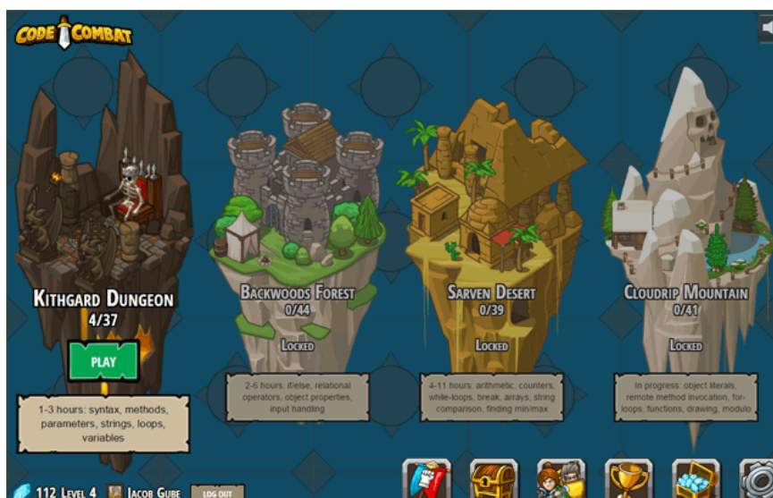
Рис. 4. CODECOMBAT –

користувачеві доступно 80 безкоштовних рівнів гри, яких повинно бути достатньо для того, щоб освоїти всі концепти (див. рис. 4).