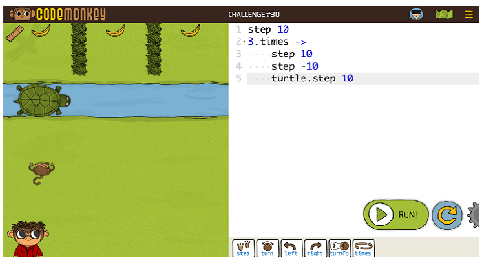
Рис. 2. CodeMonkey – опис команд

Під час гри дитина керує маленькою мавпочкою, задача якої – ходити по ігровому полю та збирати банани. Для цього гравцеві доведеться складати