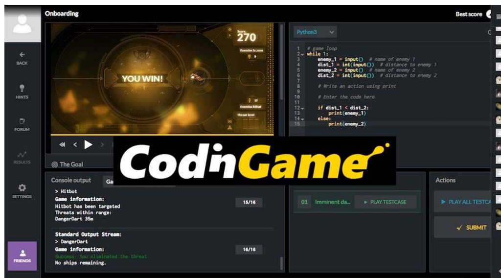
Рис. 6. CODINGAME

CODINGAME – найкращий варіант для вивчення програмування англійською мовою. Гра являє собою великий набір складних ігор для програмістів. Якщо користувач хоче поліпшити свої навички програмування, то гра CodinGame - це якраз те, що потрібно, для того, щоб поєднати приємне з корисним. Гра підтримує понад 20 мов програмування.