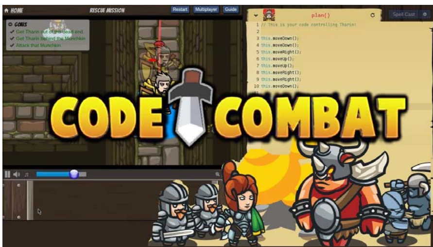
Рис. 3. CODECOMBAT

CodeCombat – це рольова HTML5-гра, що навчить основним поняттям програмування (див. рис. 3). У CodeCombat завдання гравця – провести свого персонажа через різні рівні гри за допомогою написання коду певною мовою програмування. Користувач має можливість вибрати мову яку хоче освоїти: Python, JavaScript та експериментальні версії JavaScript. Але оловне в даній грі – не мова, яку вибрали, а розуміння принципів програмування. Рівні гри побудовані як хороший курс програмування з поступовим збільшенням складності завдань.