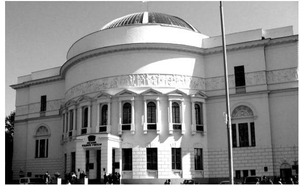
...Початок ХХІ сторіччя...

Будинок Педагогічного музею належить до числа тих архітектурних споруд, поява яких у певному місці зумовлювалась культурно-містобудівною логікою цього простору, вони природні, органічні, вони є матеріалізованим кодом території, її історії, її геоморфології.