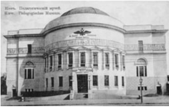
Педагогічний музей. Початок ХХ сторіччя...