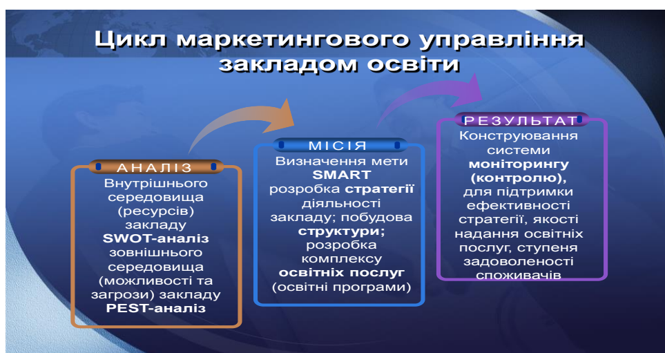
Рис. 2. Цикл маркетингового управління закладом освіти

Технологію використання маркетингового управління в освіті (рис. 2) визначаємо як поетапну діяльність з відповідними управлінськими