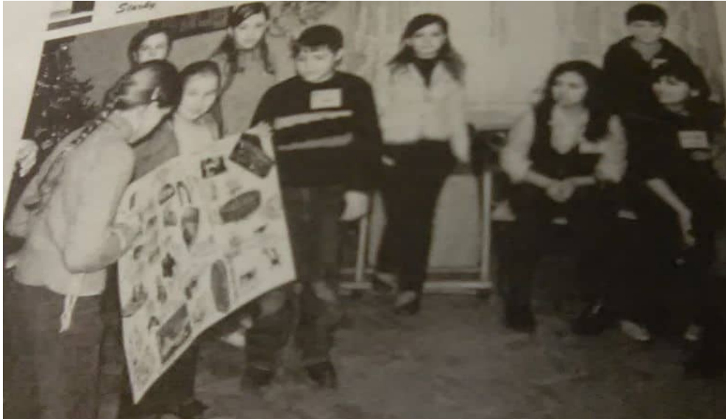
Фото. Освітнянські заходи взимку 2008 року у Львівській школі Марії Покрови для глухих дітей