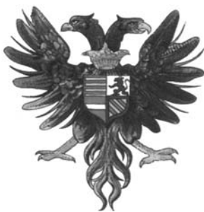
У XIII ст. гербом Священної Римської імперії став двоголовий орел, який символізував владу.

У 1026–1027 рр. німецький король Конрад II здійснив похід на Рим. Вперше в документах саме цього імператора його держава починає називатися «Римська імперія». З середини XII ст. — «Священна Римська імперія». З кінця XV ст. держава германських імператорів стала називатися «Священна Римська імперія німецької нації».