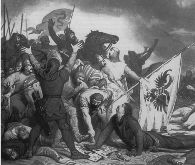
Битва біля Леньяно

▣ Як Ломбардська ліга покарала Фрідріха I Барбароссу?