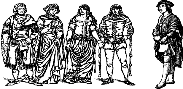
Жителі Німеччини, XIV ст.