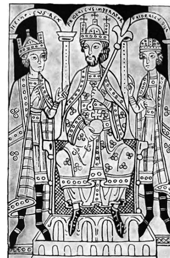
Фрідріх Барбаросса з синами. Мініатюра XII ст.