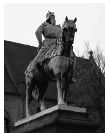
Пам'ятник Фрідріху Барбароссі у місті Гослар

Ім'я Фрідріха Барбаросси залишилося в історії не тільки завдяки його військовим походам. У XX ст. Гітлер назвав план війни проти СРСР планом «Барбаросса». Так