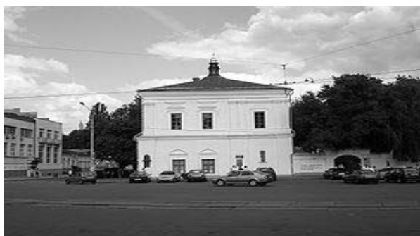
Корпус Києво-Могилянської академії

Після братської виникла Лаврська школа, а згодом вони злилися, утворивши Київську колегію. На основі колегії було створено академію, яку увесь слов'янський світ знав під назвою Києво-Могилянської. Народилася вона завдяки таким людям, як велика меценатка** Галшка Гулевичівна (За М. Слабошпицьким).