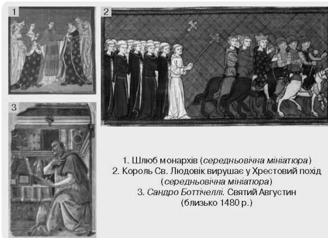
1. Шлюб монархів (середньовічна мініатюра) 2. Король Св. Людовік вирушає у Хрестовий похід (середньовічна мініатюра) 3. Сандро Боттічеллі. Святий Августин (близько 1480 р.)

▣ На основі ілюстрацій прокоментуйте, яку роль відіграє в церемонії духовенство. Як у картинах середньовічних художників простежується ставлення суспільства до духовенства?