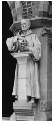
Статуя Роджера Бекона в Оксфордї

Пропонуємо уривок з практичного заняття «Виникнення слов'янської писемності. Кирило і Мефодій», на якому учні знайомляться з життєдіяльністю просвітителів, процесом створення абетки, проводять власне історико-філологічне дослідження. За таких умов зміст уроку набуває міжпредметного, багатоаспектного характеру.