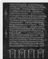
«Срібний кодекс». Переклад Євангелія мовою готів

■ Як характеризують спосіб життя і розвиток ремесел у варварських державах наведені нижче пам'ятки?