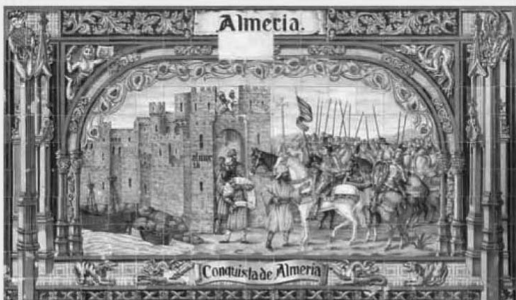
1. Королівський замок Фердинанда та Ізабелли в Сеговії 2. Емануель Готтлиб Лойце.

Христофор Колумб перед королевою Ізабеллою