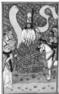
Спалення Яна Гуса (середньовічна мініатюра)

Критерій другий – зміст підручника має створити максимальні умови для ефективного компетентнісного розвитку семикласників.