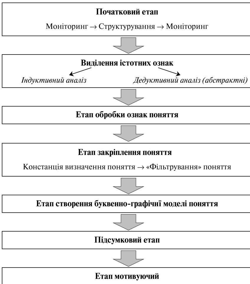
Рис. 2. Алгоритм формування навчальних понять в процесі навчання географії України.

Сьомий етап — мотиваційний (рис. 2.). Під час цього найважливішого, на нашу думку, етапу вчитель повинен надати субстрат для утворення в учнів спочатку зовнішніх, а потім і внутрішніх мотивів для самостійної роботи з навчальним матеріалом географії України, розширюючи обсяг понять, що підвищує якість знань.