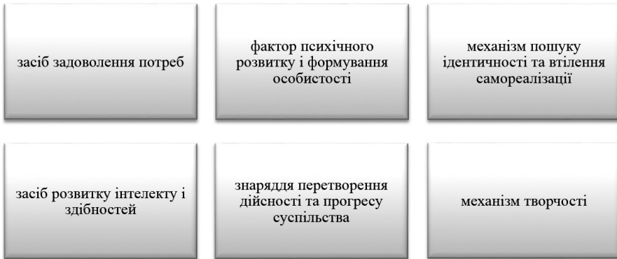
Рис. 3. Функції діяльності.

Діяльнісний підхід в освіті — це методологічний базис, на якому будуються різні системи розвиваючого навчання або освіти зі своїми конкретними технологіями, прийомами, так і теоретичними особливостями. Існуюча дидактична система Я. Коменського, не вичерпала своєї значущості, разом з тим не дозволяє ефективно здійснювати розвиваючу функцію освіти. В роботах Л. Занкова, В. Давидова, П. Гальперина, та інших педагогів-вчених і практиків, на основі педагогічної прогностики, сформульовані нові дидактичні вимоги, які вирішують сучасні освітні завдання з урахуванням запитів майбутнього. Зокрема у навчанні географії виокремлюються два системних аспекти: