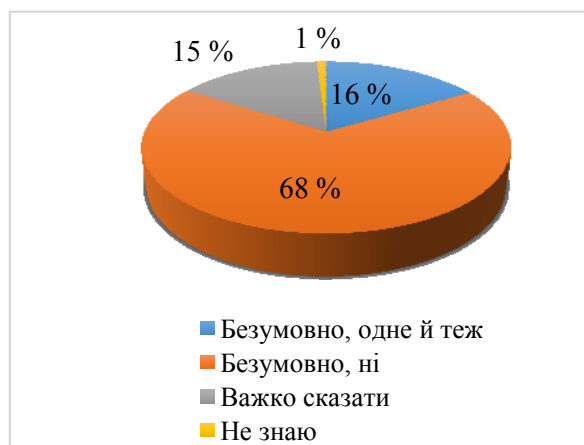
Рис. 3. Моніторинг якості освітньої діяльності та атестація закладу загальної середньої освіти це одне й теж, чи різні види управлінської діяльності?