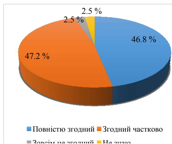
Рис. 4. Чи згодні Ви з думкою, що вдосконалення системи показників/критеріїв оцінки освітньої діяльності – це стимул підвищення якості загальної середньої освіти?