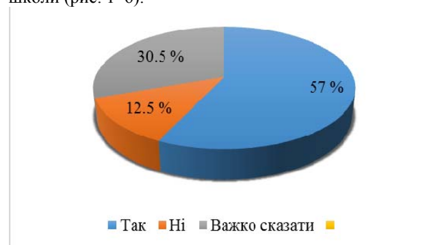
Рис. 1. Як Ви вважаєте, чи підвищить якість/результативність освітньої діяльності закладу загальної середньої освіти запровадження моніторингу показників/критеріїв якості освіти?

Результати дослідження представлені типовими відповідями проведеного опитування думок вчителів/керівників шкіл щодо сучасного стану існуючих критеріїв/показників оцінювання якості роботи школи (рис. 1–6).