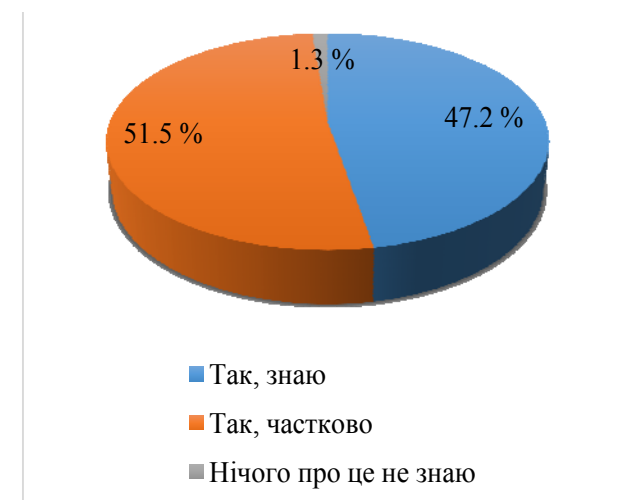
Рис. 2. Чи знаєте Ви, що таке показники/критерії якості освітньої діяльності?