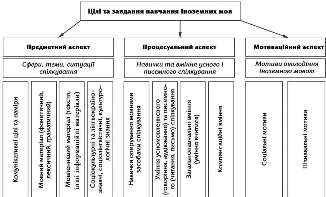
Рис. 3.1. Основні компоненти змісту навчання іноземних мов

На рисунку презентовано основні компоненти змісту навчання іноземних мов учнів початкової школи (рис. 3.1).