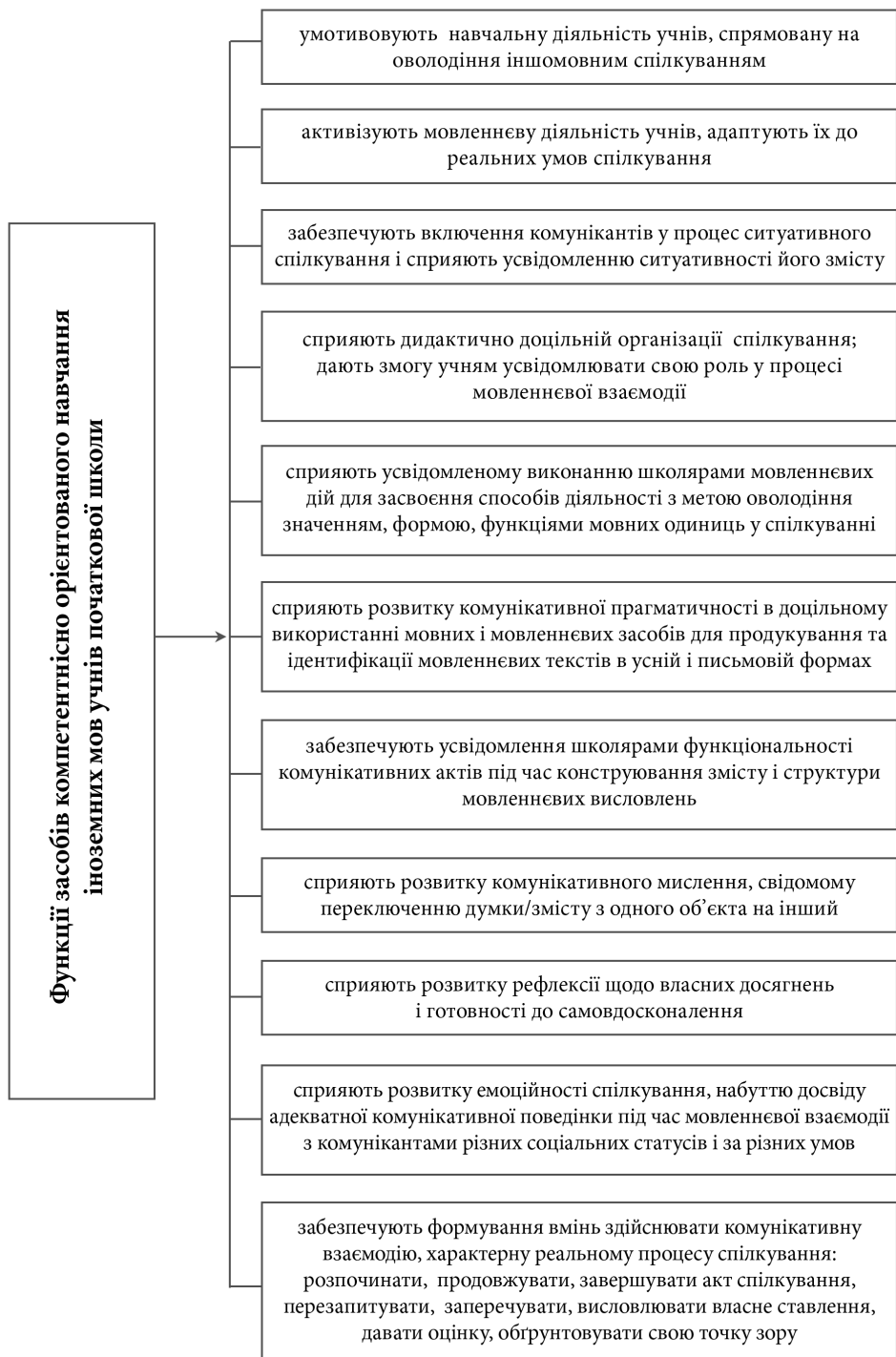
Рис. 3.4. Функції засобів компетентісно орієнтованого навчання іноземних мов учнів початкової школи