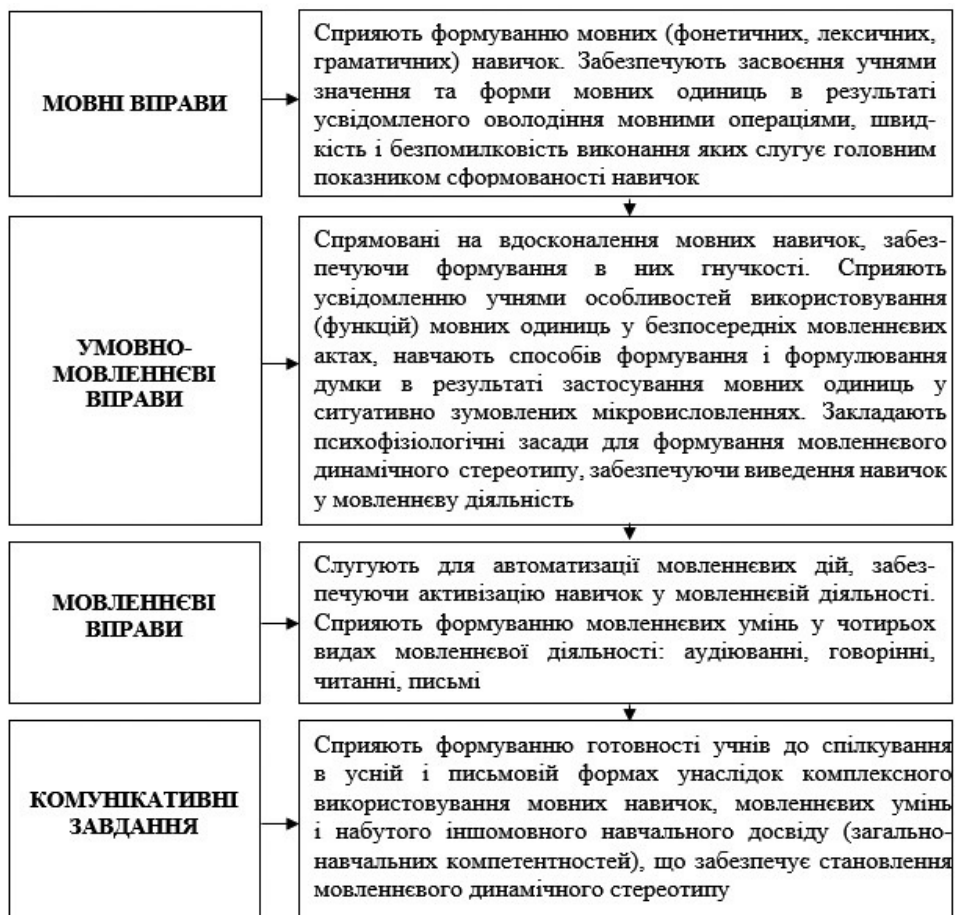
Рис. 3.3. Типологія та функції вправ і завдань для компетентнісно орієнтованого навчання іноземних мов учнів 1–4 класів

Зазначене вище дозволяє визначити й охарактеризувати типологію вправ і завдань для навчання іншомовного спілкування. Її створено відповідно до компетентнісного, комунікативного, діяльнісного підходів до навчання, а компоненти типології дають змогу враховувати індивідуальні особливості учнів, їхню різну готовність до оволодіння предметом і комунікативні наміри (рис. 3.3).