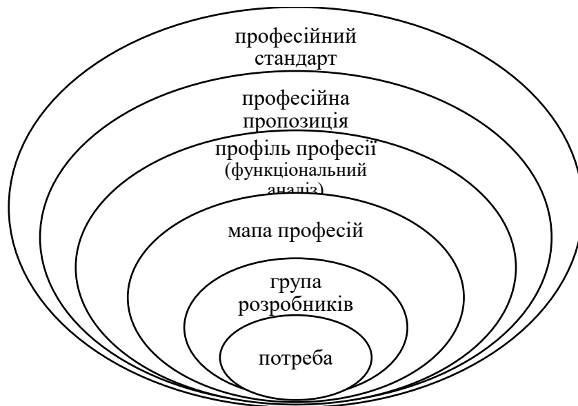
Рис. 4. Складові професійного стандарту