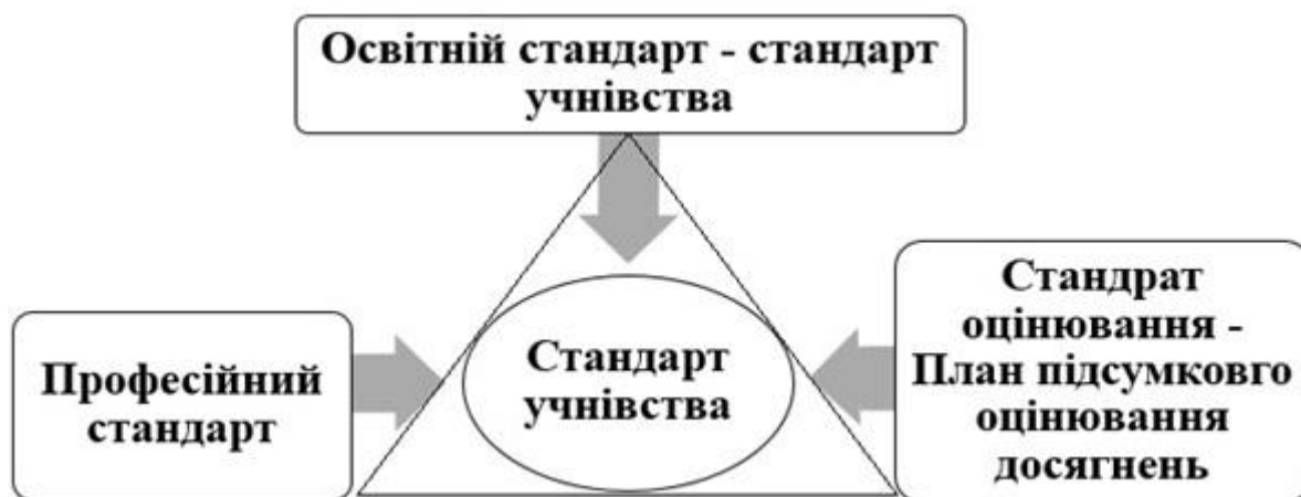
Рис. 1. Цілісна структура стандарту учнівства

Виклад основного матеріалу. Класичний «трикутник стандартів» для забезпечення якісного й повноцінного опанування відповідної кваліфікації (професії) складається з професійного, освітнього стандарту та стандарту оцінювання. У Великій Британії (цілісний) стандарт учнівства теж складається з трьох «компонентів» – професійного стандарту (ПС), освітнього, який теж називається стандарт учнівства, та оцінювання, тобто плану підсумкового оцінювання досягнень (ППОД) стандартів. То ж стандарт учнівства це одночасно і назва освітнього стандарту і комплексу трьох стандартів (рис. 1).