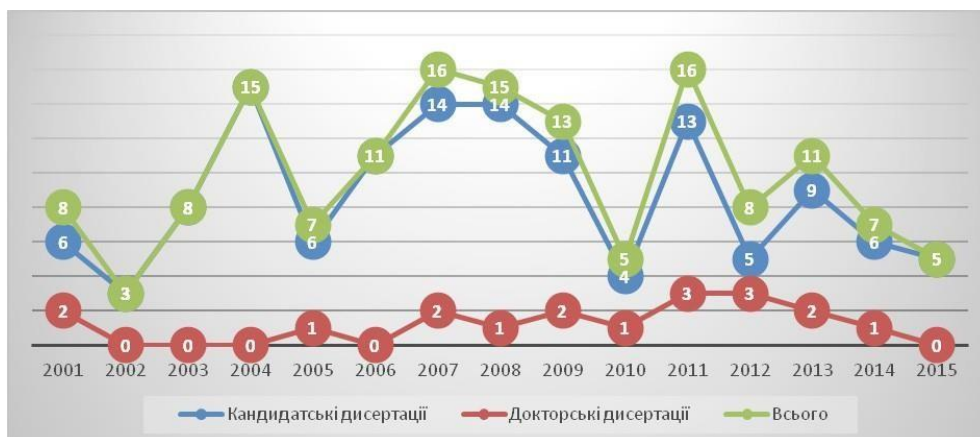
Рис. 1. Кількість докторських і кандидатських дисертацій з педагогічних наук, захищених в 2001–2016 рр.

Найбільшу кількість дисертацій, вісім, виявлено в інформаційному просторі України в 2004 і в 2011 рр.; сім дисертацій – в 2013 р. У динаміці захисту докторських дисертацій простежується стабільність захистів із середнім показником одна-дві дисертації за рік. Найбільша кількість (дві) докторських досліджень підготовлено в 2007, 2009 й 2011 рр. Наведені дані свідчать про стійкий науковий інтерес до тематичного спектра у зазначеній науковій ділянці.