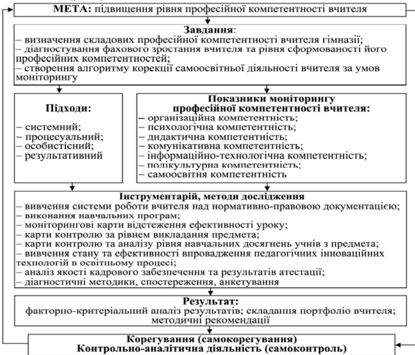
Рис. 2. Модель моніторингу професійної компетентності вчителів гімназії

Для створення системи професійного зростання вчителя вагому роль відіграє моніторинг, завдяки якому відбувається накопичення інформації про кожного педагога, з'являється можливість прогнозувати та моделювати розвиток і стан зростання професійного рівня вчителя. Презентуємо розроблену модель моніторингу професійної компетентності вчителя гімназії (рис. 2).