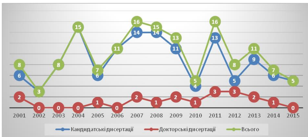
Рисунок 1. Кількість докторських і кандидатських дисертацій з педагогічних наук, захищених в 2001-2016 рр.

Виявлено та згруповано за указаними хронологічними рамками сімдесят чотири докторські та кандидатські дисертації з педагогічних, психологічних та філософських наук за 2001–2016 рр., які можна вважати репрезентативною вибіркою за такими критеріями: хронологічний, персонологічний та проблемно-тематичний діапазон, що маркується в темі дисертацій (рис.1).