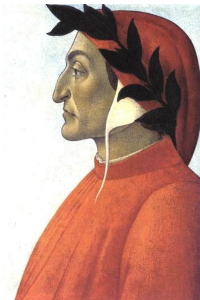
Сандро Ботічеллі. Портрет Данте. 1495

Душа Данте була глибоко ображена наклепом і невдячністю співвітчизників. Він став вигнанцем — і так 19 років, до самої смерті. Однак саме тепер, коли життя, здавалося, прийшло до краху, Аліг'єрі здійснює справжній творчий подвиг. Він зачинається в гірському монастирі Авелано, проклявши всі партії, створює «партію самого себе» і починає писати «Божественну комедію» — її першу частину — «Пекло». Сам поет називав свій твір просто — «Комедією», оскільки він має щасливу і радісну розв'язку (сходження у фіналі до сфери Раю). Епітет «Божественна» додали поемі захоплені нащадки (вважають, першим — Джованні Боккаччо, автор «Декамерону»).