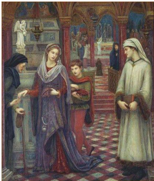
Марі Стіллман. Данте і Беатріче. 1885.

Філософ і культуролог Олександр Доброхотов 2 вважає такою причиною відчуття обраності, як у багатьох геніїв. Час потребував синтезу. Середні віки заговорили через «Божественну комедію» Данте – це дивовижне зведення всього людського досвіду в приголомшливий символічний ансамбль. Данте відчув, що це повинен зробити він. Любов до Беатріче була його емоційним імпульсом. Ним рухало відчуття того, що можна гармонізувати світ, підготуватися до його кінця, очиститись духовно і піднятися до зірок.