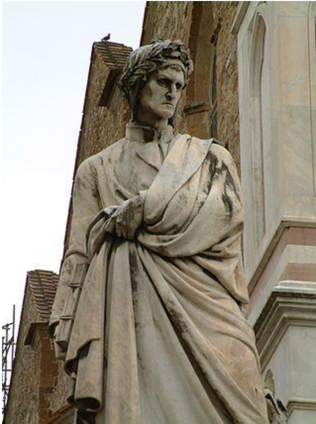
Пам'ятник Данте 1865 р. Флоренція. Скульптор Е. Пацці.

Учитель редагує колективну біографічну статтю, надаючи їй урочистого, публіцистичного стилю, розставляючи потрібні акценти. Наводимо зразок такої біографії.