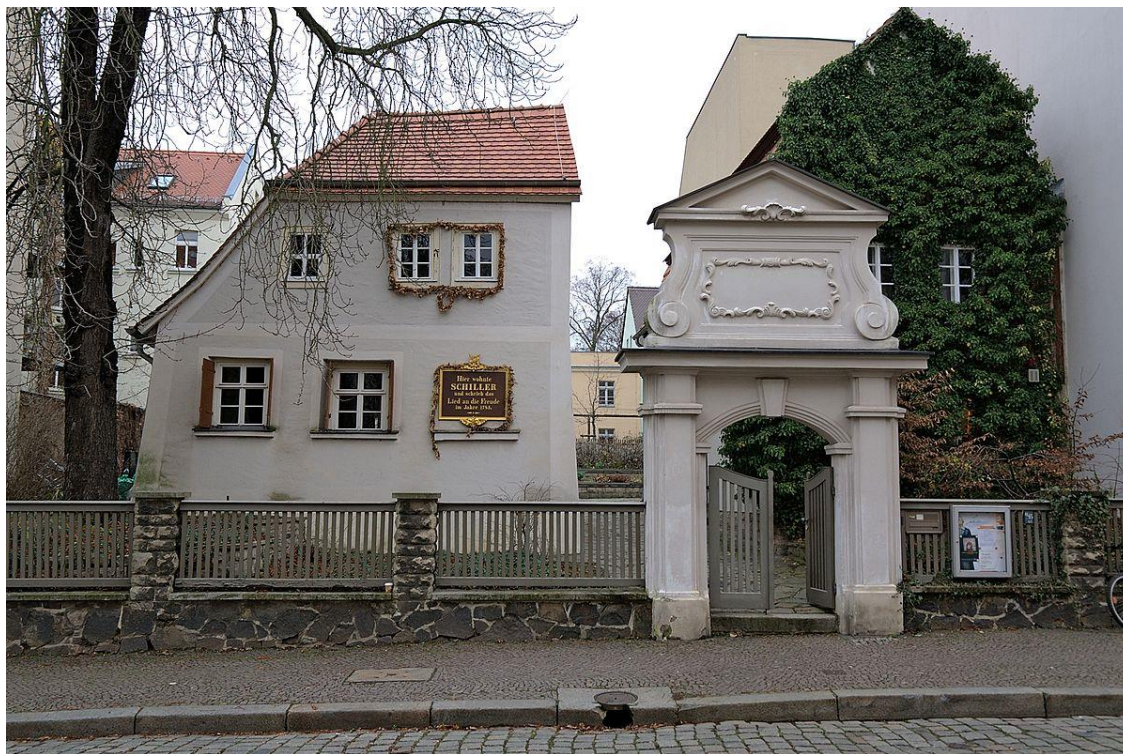
Будинок-музей Ф. Шиллера у Лейцигу.

Життя в академії стало справжнім випробуванням для майбутнього поета. У військовій формі він виглядав більш ніж безглуздо: худі ноги й величезні ботфорти, в яких він крокував, як журавель, не згинаючи колін. Щоб хоч трохи відпочити від муштри, Фрідріх обрав медичний факультет і з завершенням академії служив полковим лікарем.