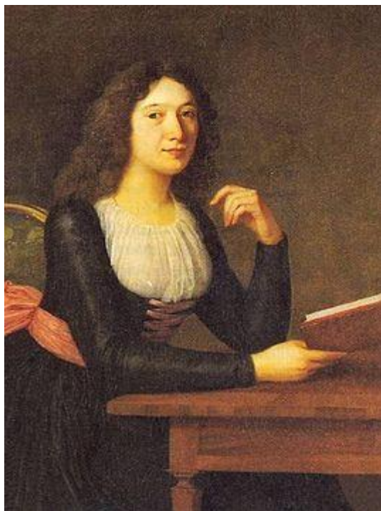
Портрет Шарлотти фон Ленгефельд роботи Людовики Сімановіц.

сільській церкві поблизу Єни 20 лютого 1790 року зберігся запис про їхнє вінчання.