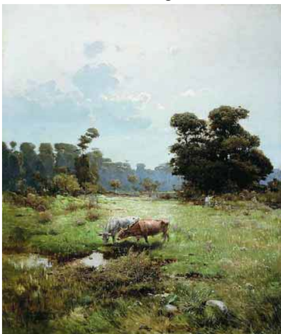
«Сергій Васильківський. «Козача левада» (1893)

зацікавлять. Біографічні відомості повинні допомогти учневі уявити ідейно-моральне обличчя письменника у всій його широті, складності, а іноді – суперечності, підготувати до сприйняття тексту не тільки як до образного відбиття дійсності, але і як до розуміння прояву духовного життя конкретної людини. Тоді читач зрозуміє, наскільки індивідуальна природа творчості, наскільки письменницький стиль пов'язаний з його ідейно-моральними переконаннями. У кожного автора є характерна риса, що найбільше впливає на його життєву позицію і відбивається в творчості. Пошук або розкриття такої риси стане стрижнем кожної біографічної теми. Наприклад, у біографії письменників велика увага приділяється взаємовпливам життя письменника і його творчості, впливу родини на формування особистості автора, важливості освіти і самоосвіти для подальшого успіху і професійного становлення, національної свідомості і мови, еволюції письменницьких зацікавлень і ставлень до тих чи інших ідей і тем, важливості знання багатьох європейських мов, що давало можливість українським авторам реалізувати себе й у перекладницькій діяльності, тощо. Особи письменників показані цілісними і багатогранними.