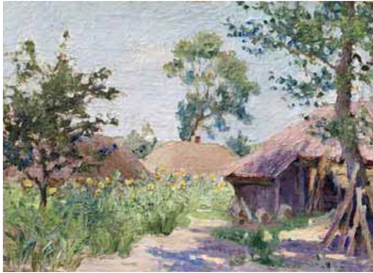
Микола Бурачек. «Влітку» (II чверть XX ст.)