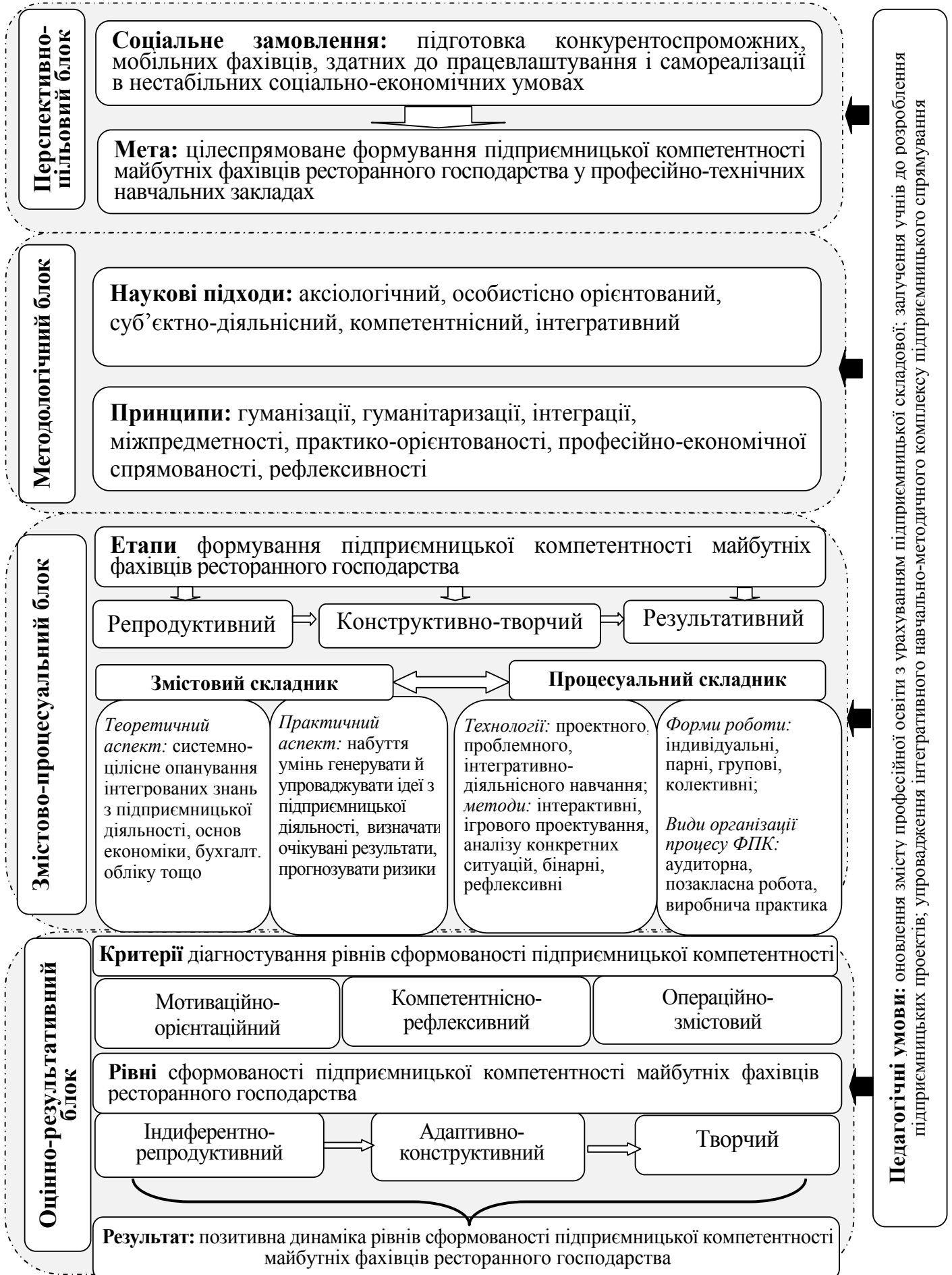
Рис. 1. Модель формування підприємницької компетентності майбутніх фахівців ресторанного господарства у ПТНЗ