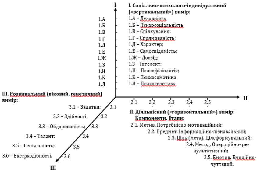
Рис. 1. Тривимірна психологічна структура особистості на 1-3 етапах конкретизації відповідних категорій і понять наукової психології (Рибалка В.В., 2018).

Постає питання про наявність таких особистісних орієнтирів – що вони уявляють собою. Наш досвід роботи в цьому напрямку свідчить про те, що роль такого орієнтира спроможна виконувати психологічна структура особистості. Наведемо як приклад розроблену нами тривимірну, поетапно конкретизовану психологічну структуру особистості на перших трьох етапах її конкретизації-узагальнення.