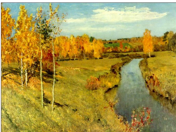
І.Левітан «Золота осінь»