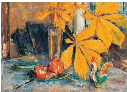
С.Шишко «Кленові листя»