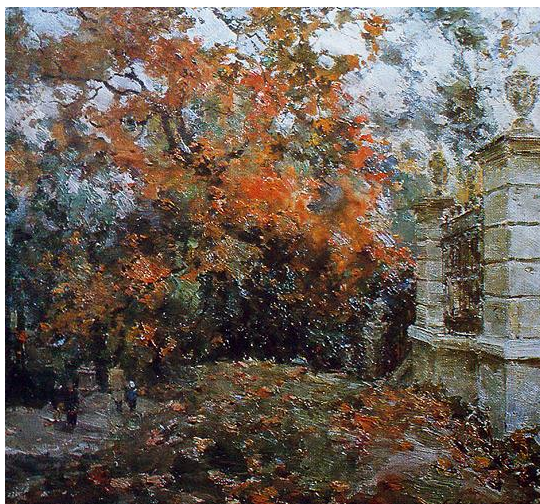
С.Шишко «В парку»