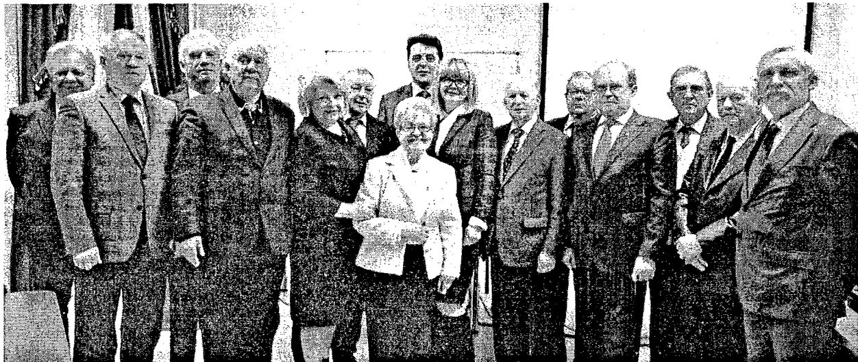
Співробітники Відділення професійної освіти і освіти дорослих НАПН України

На дослідження регіонального компонента у змісті професійної освіти спрямовувалася діяльність