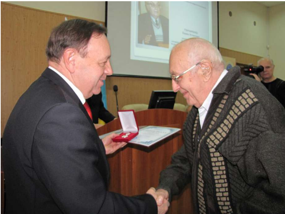
Ректор Хмельницького національного університету професор М.Є. Скиба вручає академіку С.У. Гончаренку громадську відзнаку – срібну медаль «Василь Зеньковський» (м. Хмельницький, жовтень 2011 р.)