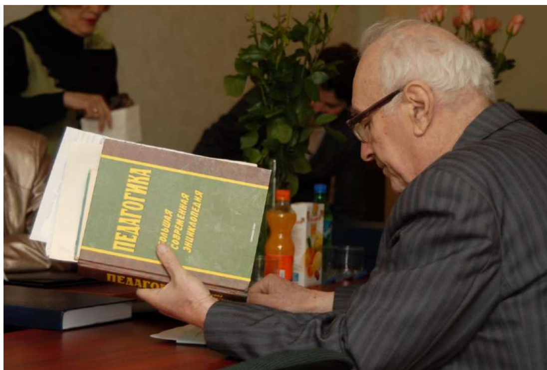
Академік С.У. Гончаренко на засіданні спеціалізованої вченої ради Інституту педагогіки і психології професійної освіти АПН України (захист дисертації М.Г. Чобітька, 2007 р.)