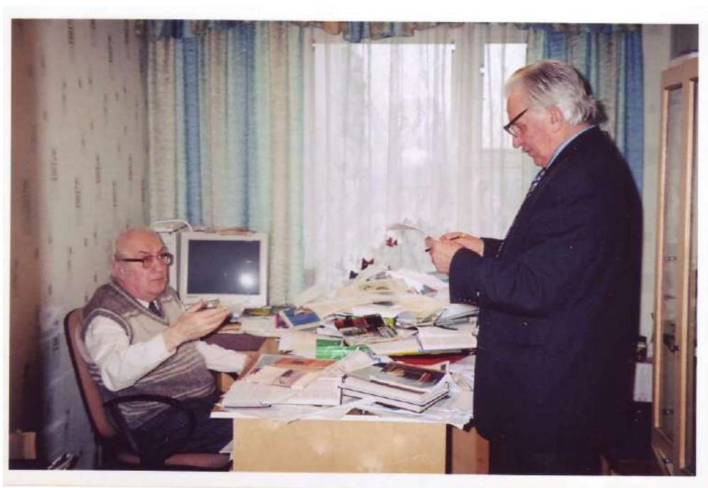
Академік С.У. Гончаренко і М.М. Солдатенко у робочому кабінеті вченого в Інституті педагогіки і психології професійної освіти АПН України (грудень 2006 р.)