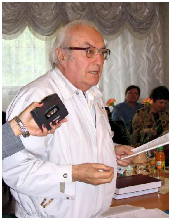
Академік С.У. Гончаренко виступає на засіданні спеціалізованої вченої ради в Інституті педагогіки і психології професійної освіти АПН України (захист Н.І. Мачинської, 2006 р.)