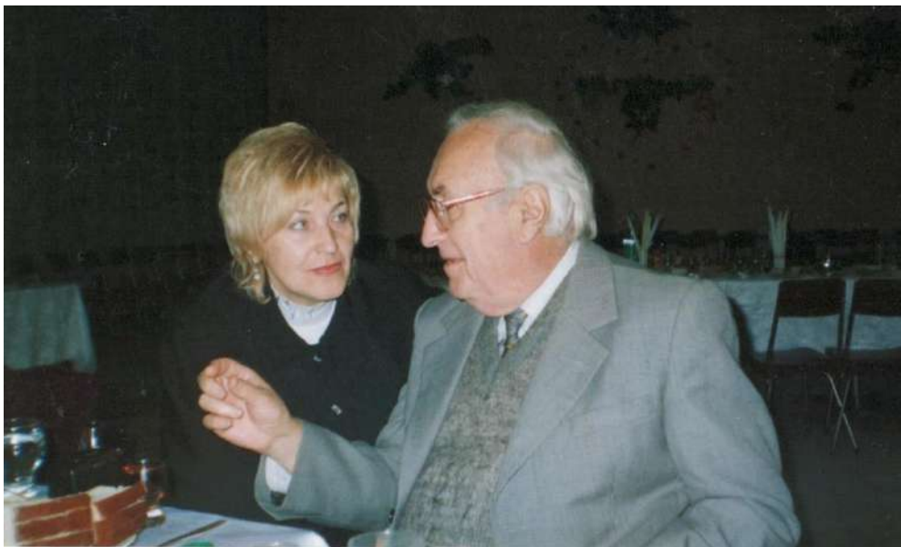
Академік С.У. Гончаренко і член.-кор. АПН України В.О. Радкевич на науково-практичній конференції у Хмельницькому національному університеті (м. Хмельницький, 2005 р.)

На фото зліва на право В.І. Свистун, С.У. Гончаренко, член.-кор. АПН України В.О. Радкевич, Л.З. Тархан