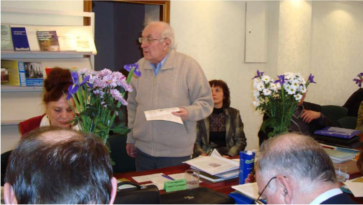
Академік С.У. Гончаренко на засіданні спеціалізованої вченої ради в Інституті педагогічної освіти і освіти дорослих НАПН України