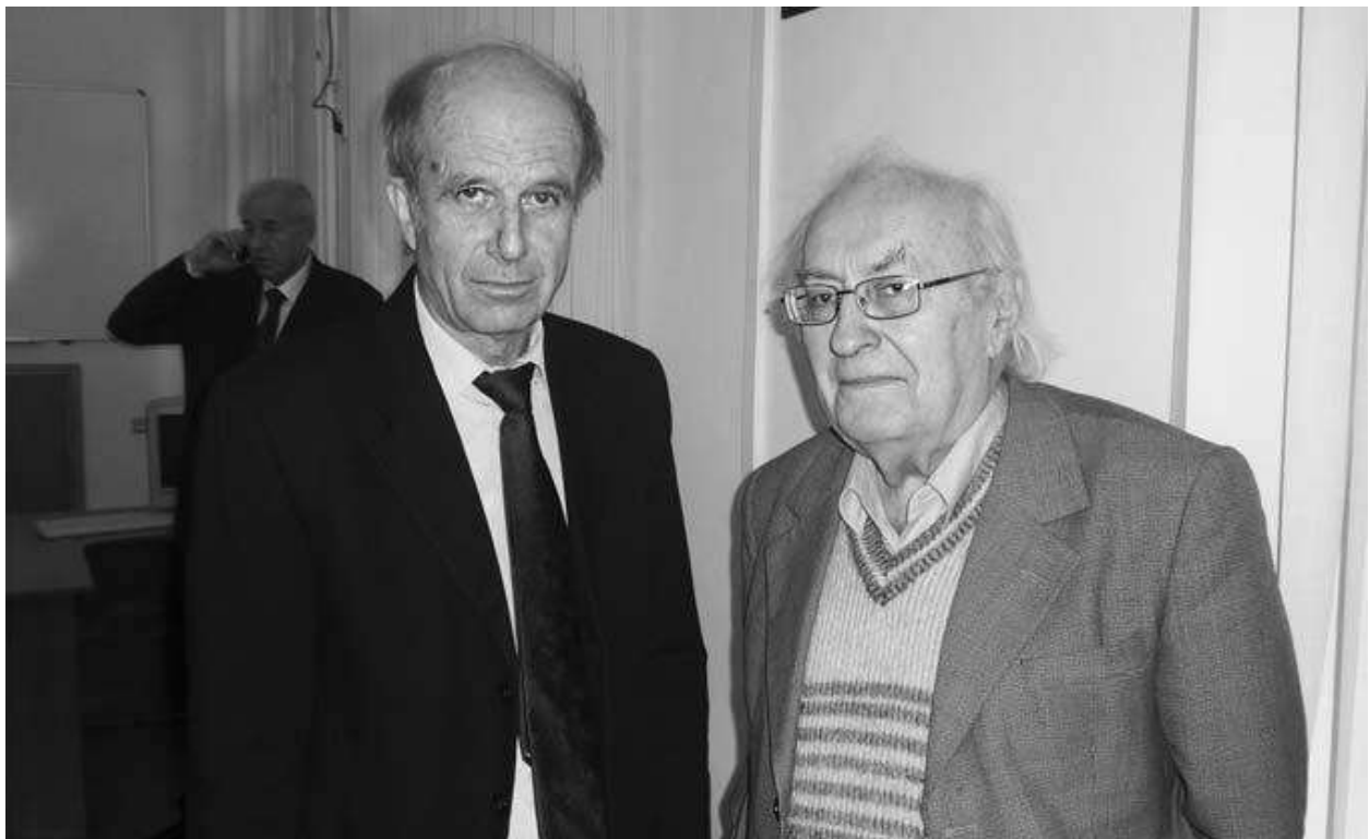
Академік С.У. Гончаренко і член-кореспондент АПН України Ю.І. Мальований (2007 р.)