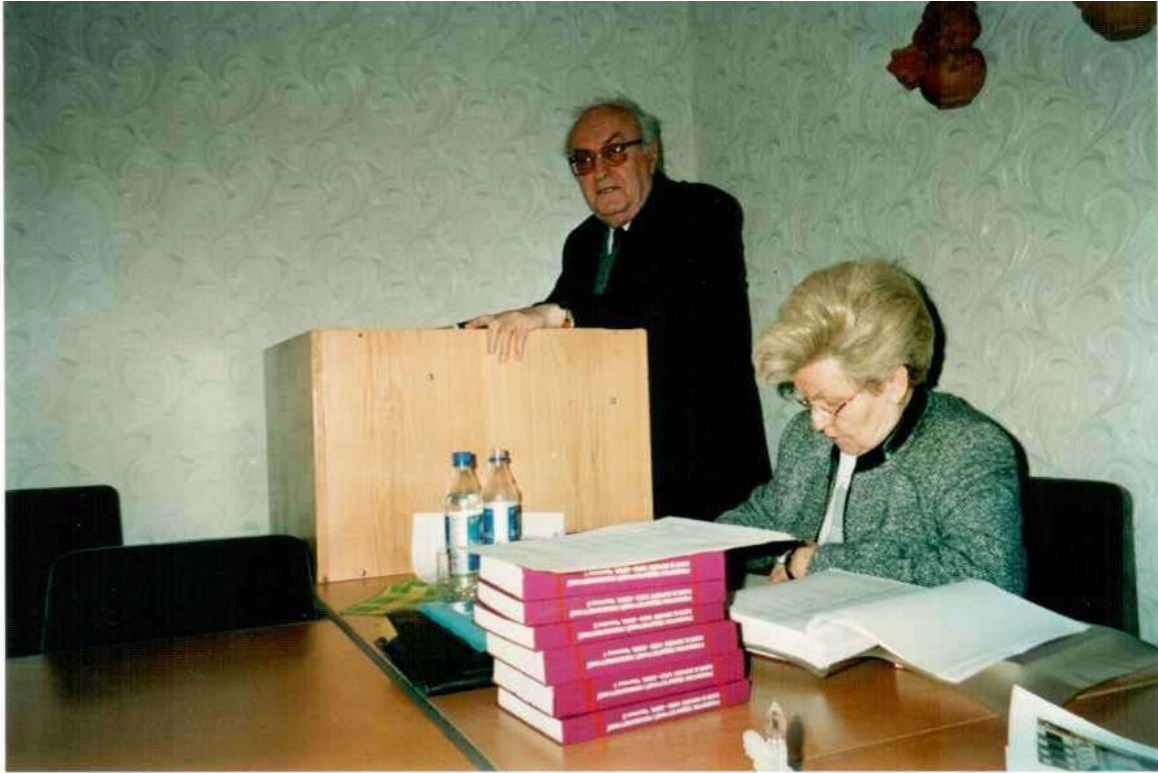
Академіки С.У. Гончаренко і Н.Г. Ничкало на звітній конференції Інституту педагогіки і психології професійної освіти АПН України (березень 2003 р.)