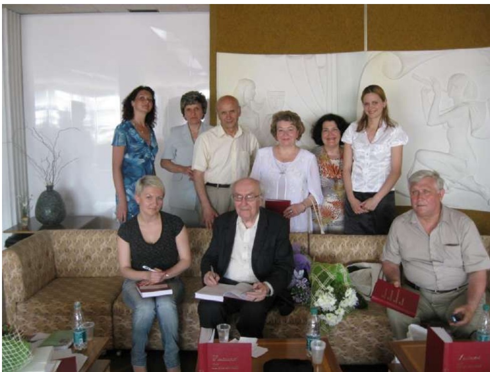
Академік С.У. Гончаренко з викладачами кафедри педагогіки Рівненського державного гуманітарного університету (м. Рівне, травень 2011 р.)