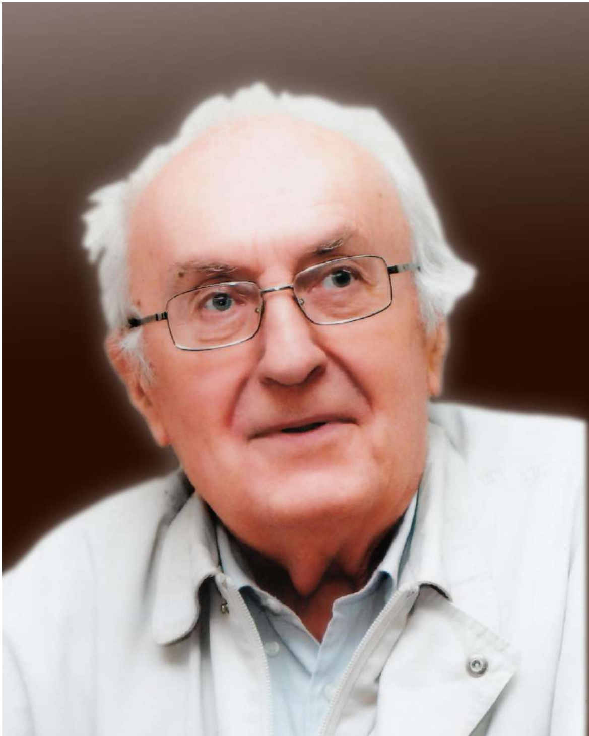
Доктор педагогічних наук, професор, дійсний член НАПН України СЕМЕН УСТИМОВИЧ ГОНЧАРЕНКО (1928 – 2013)