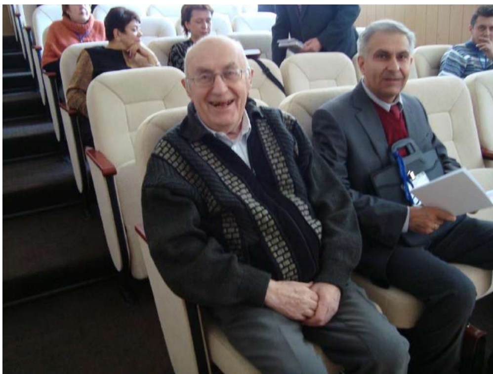
Академік С.У. Гончаренко на VI Міжнародній науково-практичній конференції «Професійне становлення особистості: проблеми і перспективи» (м. Хмельницький, жовтень 2011 р.)