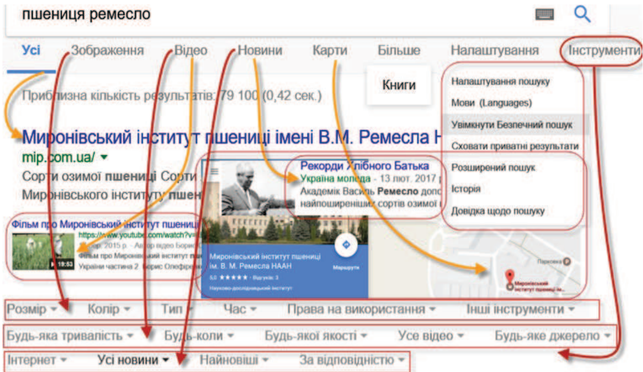
Рис. 3. Засоби додавання умов пошуку пошукової системи Google

Нині ними передаються не тільки текстові повідомлення, але й голосові повідомлення, зображення, відео, а також проводяться такі дії, як спільне малювання