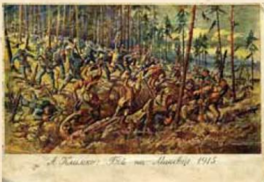
Листівка «Бій за Маківку»

Дим з наших і московських шрапнелів сповив гору. Щохвилини його прошивали блискавиці — то рвалися шрапнелі. Не поодинокі, а по чотири, по шість, по десять. А їм відповідала гора, вибухами землі. В цих вибухах потрощені смереки, фонтани каміння і людські руки, ноги. Клекотили скоростріли, гупали гранати — здавалося, гора рухається, дихає пеклом. Це був третій день московського наступу на Маківку. Змагалися дві сили. Одна сказала за всяку ціну візьму, а друга відповіла: за всяку ціну не віддам.