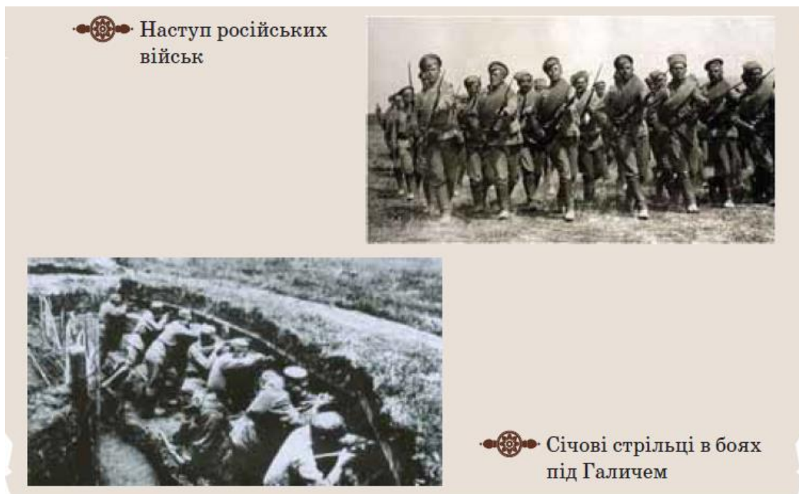
Рис.2. Фотодокументи до теми «Україна в умовах розгортання Першої світової війни»

Наприклад, на сторінці 23 підручника ви можете знайти дві фотографії (рис.2), які зображують вояків двох армій, якій протистояли одна одній. Саме опрацьовуючи подібні візуальні джерела, ми можемо запросити учнів до порівняння , знаходження подібного і відмінного.