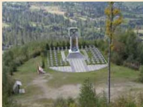
Меморіал УСС на горі Маківці