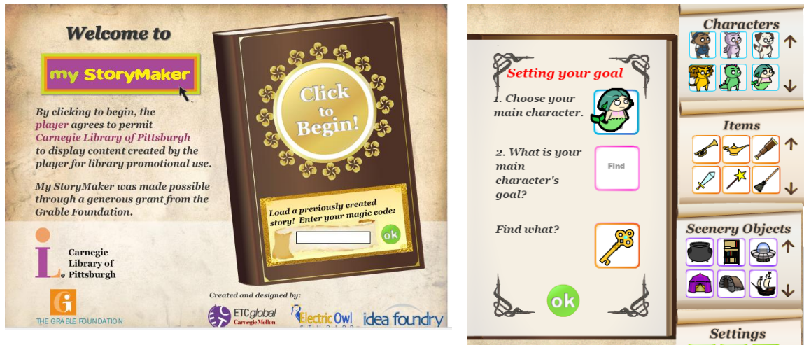
Рис.3. Інструмент My StoryMaker http://www.carnegielibrary.org/kids/storymaker/embed.cfm

Наприклад, вільний інструмент My StoryMaker (рис.3) дозволяє створити просту історію у вигляді дитячої книжки, шляхом обирання головного персонажу, його мети та тих об'єктів, які він хоче знайти, отримати і т. і.