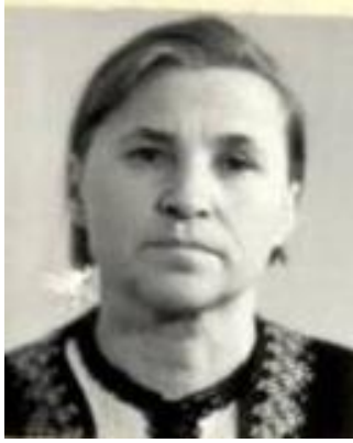
Олександра Михайлівна Бандура 1917–2010

Одним із ефективних шляхів вивчення науково-методичних здобутків минулого є персоналізовані дослідження у галузі предметної дидактики. З огляду на це цілком слушним є твердження Г. Токмань щодо «актуальності формування персональної історії методики навчання літератури, адже завдяки персоналізованому дослідженню минулого не тільки пошановується конкретна талановита особистість, яка зробила значний внесок у предметну дидактику, а й окреслюється традиція, що виявилася плідною в гуманітарному поступі України» [6, с.10].