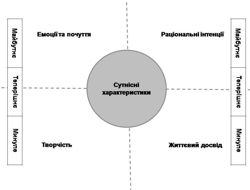
Рис. 3. Базові компоненти інтерпретації колажів, створених із використанням інтернет-контенту

Аналіз: пропонується здійснювати за схемою інтерпретації візуальних образів у колажах із врахуванням просторового розташування зображень як індикатора часової перспективи (рис. 3). Добираються й аналізуються найчастіше повторювані зображення, тоді як найменш використовувані не враховуються. З найуживаніших зображень дослідник може «скласти», відтворити інтегральний колаж на задану тему.