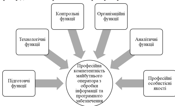
Рис. 2. Структурно-функціональна модель майбутнього кваліфікованого робітника з професії 4113 «Оператор з обробки інформації та програмного забезпечення» оператора з обробки інформації (2017)

Підсумовуючи результати нашого наукового пошуку, збору, оброблення та аналізу інформації, отриманої з різних джерел, можна побудувати структурно-функціональну модель майбутнього кваліфікованого робітника з професії 4113 «Оператор з обробки інформації та програмного забезпечення» нового типу (2017 року), що зображена на рисунку 2.