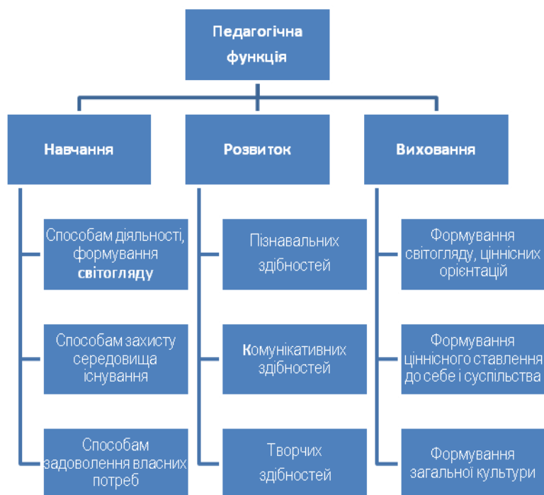
Рис. 3. Структура педагогічної функції

особистісну орієнтацію навчання, людина – це не тільки рушійна сила суспільного прогресу, але і його вища мета. Педагогічна діяльність як рід суспільної діяльності відображає ставлення у системі «людина-людина». Вона є базовою серед видів діяльності та передбачає «відтворення людини-особистості». Тобто, родовою функцією соціальної системи є педагогічна функція, а педагогічна діяльність означає реалізацію цієї функції. Структуру педагогічної функції представлено у вигляді схеми (рис. 3) [1, с. 11].