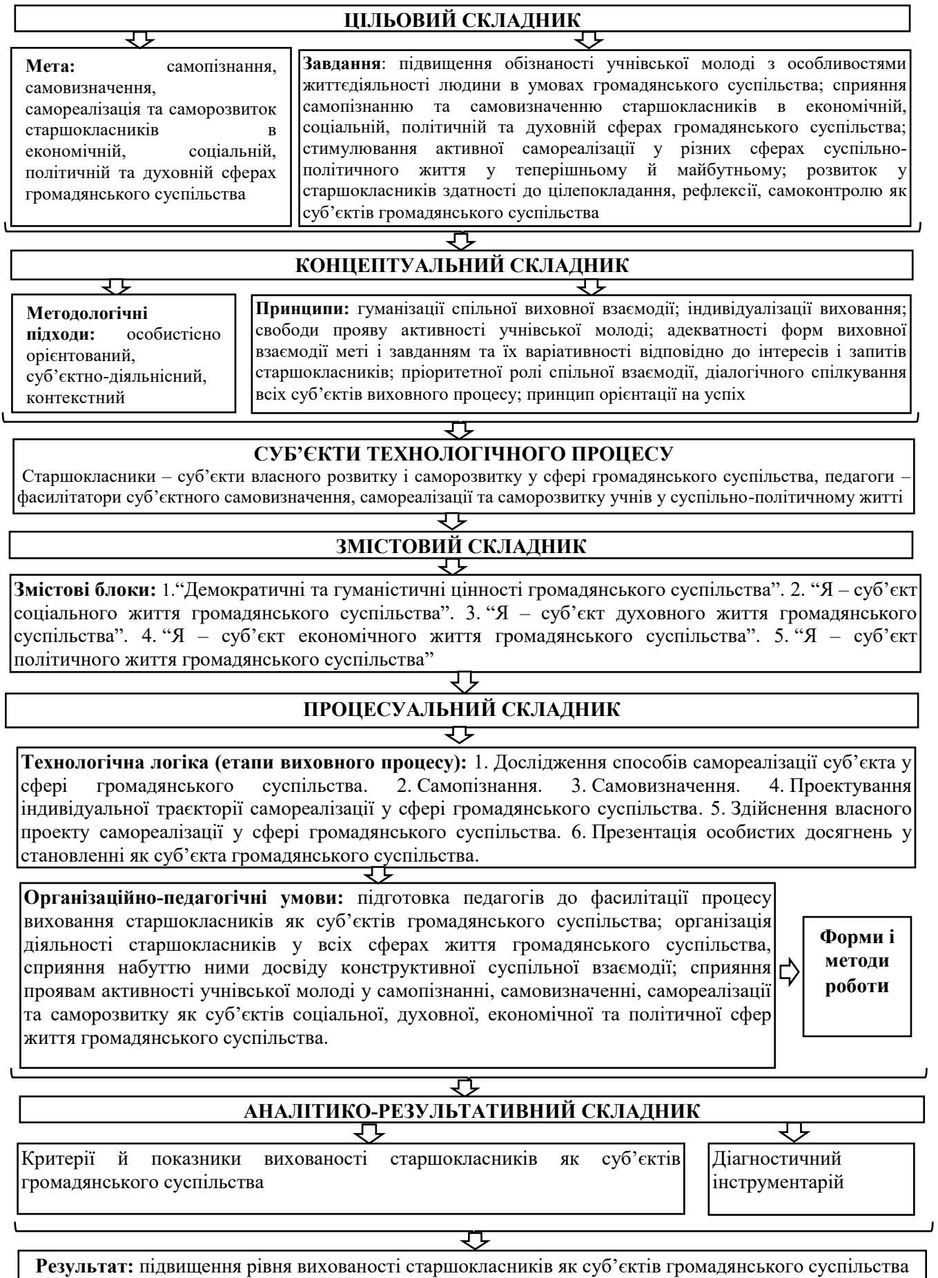
Рис. 1. Технологія виховання старшокласників як суб'єктів громадянського суспільства у позакласній діяльності