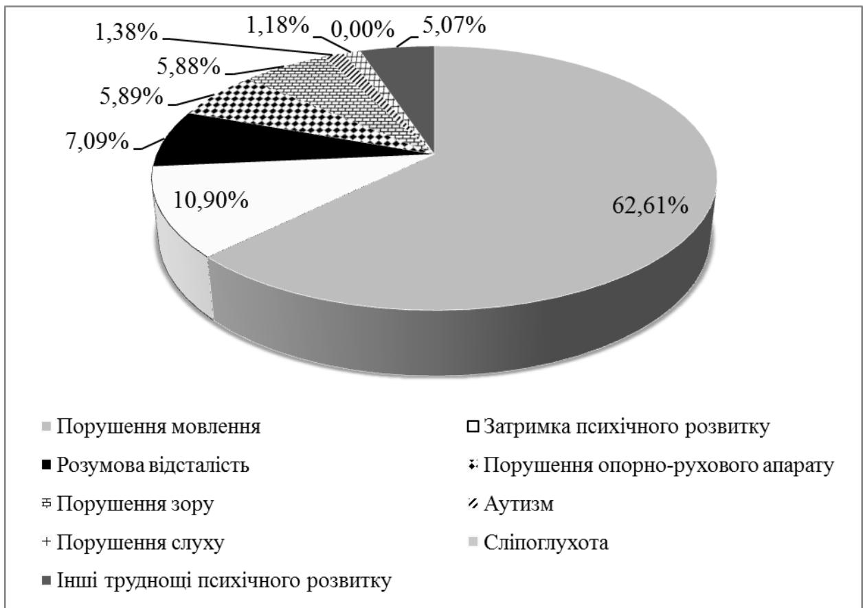
Рис. 1.3. Кількість дітей за видами порушень психофізичного розвитку та їх домінуванням виявлених вперше у 2015-2016 н.р.