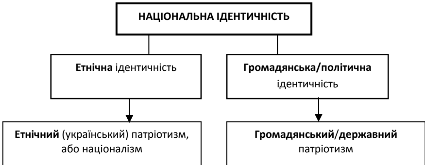
Рис. 1.2. Види національної ідентичності та відповідні види патріотизму

не усвідомлене, а пізніше – усвідомлене відчуття людиною власної належності до певної етнічної групи, що має свою назву, власну історичну територію, історичну пам'ять, спільну масову, громадську культуру, свою мову, традиції, вірування і, що особливо важливо, спільні міфи.