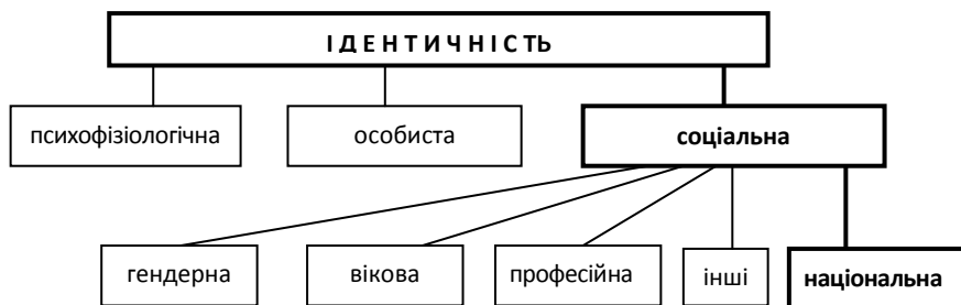
Рис. 1.1. Види і різновиди ідентичності

зразком, еталоном. Ідентифікація (від лат. identicus – тотожний) являє собою процес ототожнення себе з іншим індивідом або групою (уподібнення до них), основою якого є певний емоційний зв'язок з ототожнюваним об'єктом. Оскільки людина, як правило, має численні соціальні зв'язки і тому ідентифікує себе в різних сферах, відносячи себе водночас до різних значущих груп, ідентичність стає багатогранною (рис. 1.1).