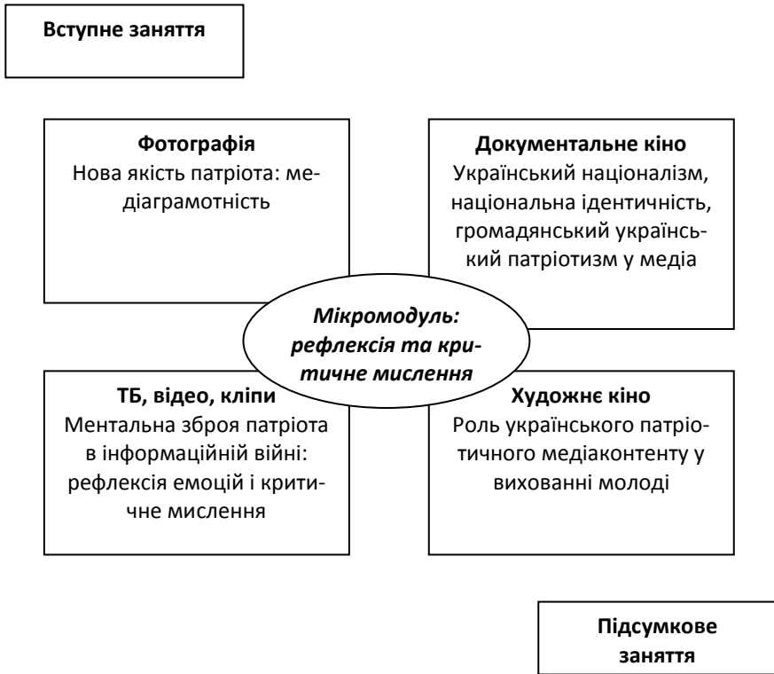
Рис. 3.1. Модулі методики «Я – патріот»

участі і роботи в групі з розвитку патріотизму і критичного мислення засобами медіаосвіти (рис. 3.1).