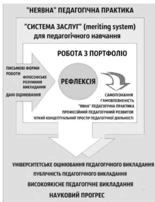
Рис. 1. «Система заслуг» (meriting system) у педагогічному навчанні.

Виклад основного матеріалу дослідження. Університет Оулу 1994 року був першим, який офіційно застосував «систему заслуг» (meriting system) для педагогічного навчання (Рис. 1).