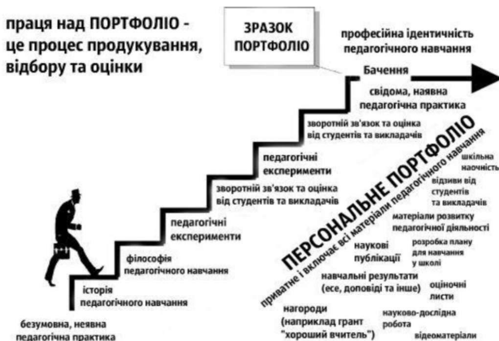
Рис. 3. Кроки для роботи з персональним портфоліо.

Досвід фінських педагогів та вчених показує, що найбільш ефективним способом у покращенні педагогічної практики є визнання і вивчення власної філософії навчання, щоб в подальшому розвивати власні теорії навчання. Крім історії навчання та філософії навчання велика увага звертається на педагогічний експеримент та оцінку від одногрупників та викладачів. Така оцінка стимулює до подальшого розвитку особистих методів навчання та проходження педагогічної практики. Професійний досвід майбутнього вчителя розвивається поступово, відповідно набутого досвіду, педагогічної підготовки та наукових експериментів. Кожен учитель повинен знайти свій власний стиль якісного педагогічного викладання у школі [7, с. 58].