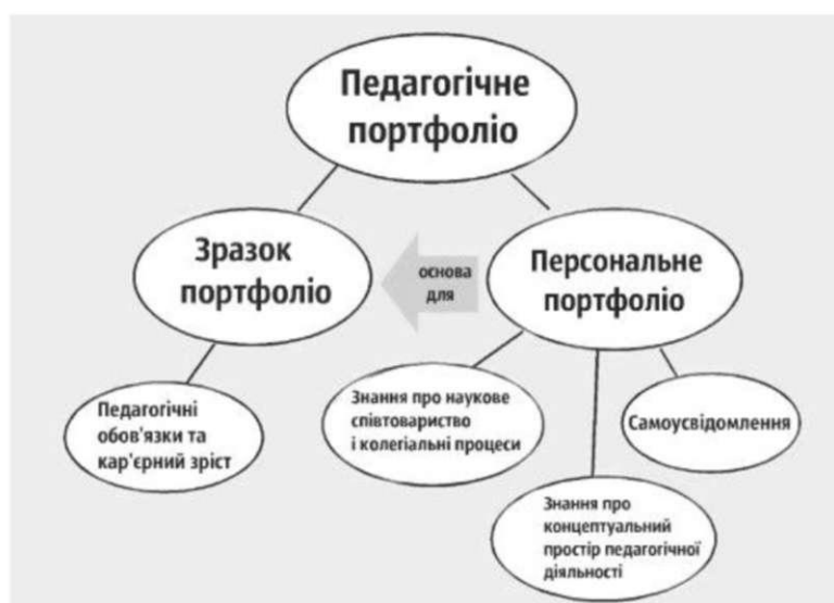
Рис. 2. Аспекти педагогічного портфоліо.

У період практики (нагадаємо, що практика у фінській педагогічній освіті проходить протягом всього періоду навчання) складається особисте портфоліо студента, що містить навчальний матеріал, який відображає його практику, а також оцінку виконаної роботи. Складання портфоліо також концентрується і на аналізі викладання різних предметів [6, с. 236]. Студенти спостерігають за викладанням своїх одногрупників і висловлюють свої оцінки, щодо них, у своїх власних портфоліо. Основна функція портфоліо - розвиток власних педагогічних вмінь. Фінські вчені вважають його відмінним засобом для самооцінки вчителів. Основна мета портфоліо - це продуктивне забезпечення відповідних методів роботи і практики для удосконалення педагогічного викладання у школі, а також вважається досить корисним засобом для саморефлексії. На рисунку 3 відображено необхідність послідовних кроків для роботи з персональним портфоліо (personal portfolio) [8, с. 19].