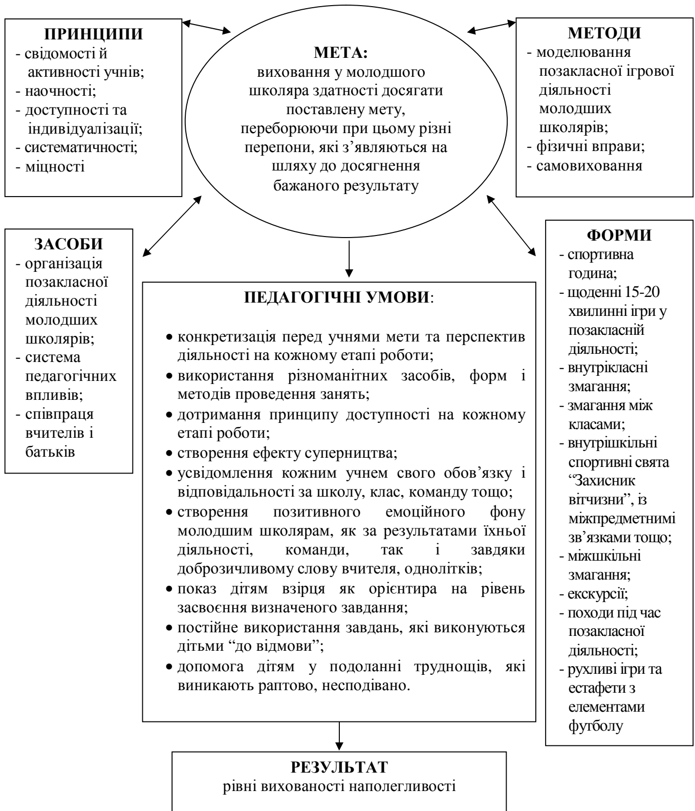
Рис. 1. Педагогічна модель виховання наполегливості молодших школярів у процесі позакласної ігрової діяльності

Технологія виховання наполегливості молодших школярів у процесі позакласної ігрової діяльності подана на схемі 1.