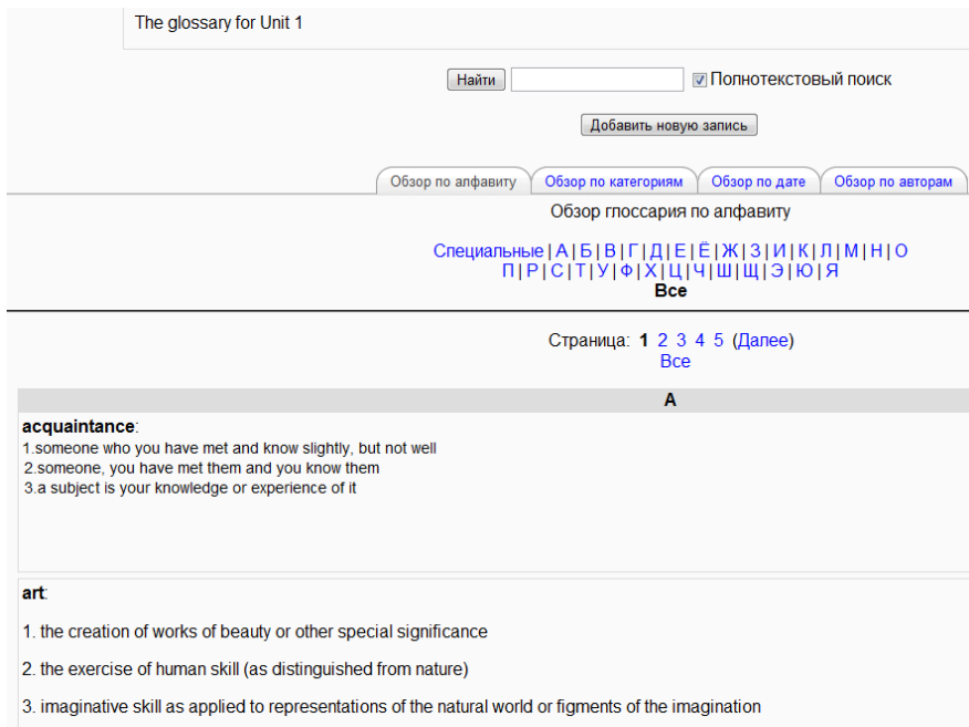
Рис. 2. Зразок подання лексичного матеріалу в електронному глосарії

Планування здійснювалося нами з урахуванням того, що кожна тема в електронному навчальному курсі у системі Moodle матиме допоміжний граматичний теоретичний матеріал, що надасть можливість студенту пригадати базові необхідні знання для подальшого опанування навчального матеріалу. Наприклад, розглянемо модуль 1 з теми «Connect». На першому занятті розглядається тема з граматики «Використання роз'єднувальних питальних речень» (Tag questions) (рис. 3). Саму структуру цих видів запитань та загальні правила їх вживання студенти мають знати у межах базової загальноосвітньої підготовки, а в самому модулі розглядається їх вживання таким чином: