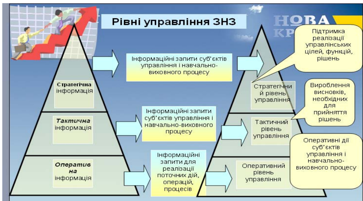
Рис. 2. Рівнева структура управління загальноосвітнім навчальним закладом

Ієрархічність структури процесу управління відображається також у жорсткій зумовленості усіх управлінських функцій визначеною перед системою метою за адміністративно-командної форми управління та у м'якій партнерсько-діалоговій взаємодії суб'єктів на горизонтальних і вертикальних рівнях організаційної структури закладу (рис. 2). Адже мета – це системоутворювальний складник управління, кінцева точка діяльності кожної особистості та колективу, усієї соціально-педагогічної системи, яка відображає запрограмований бажаний результат.