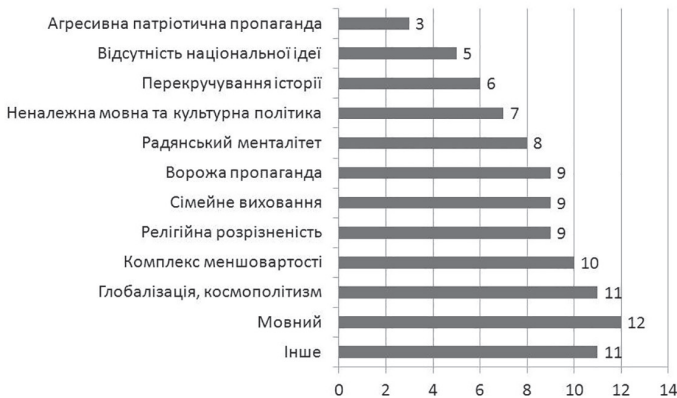
Рис.1. Основні бар'єри національної самоідентифікації (%) (за результатами якісно-кількісного контент-аналізу)

Аналіз результатів емпіричного дослідження дозволив визначити основні види комунікативних бар'єрів, які, на думку досліджуваних, виникають в процесі національної самоідентифікації молоді (Рис.1).