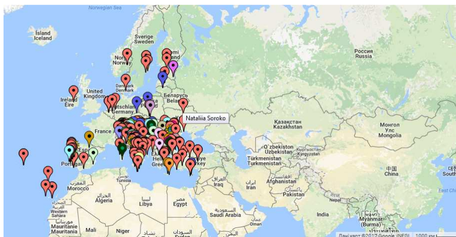
Рис. 2. Фрагмент мапи, що відображає місця, де проживають ті, хто зареєструвалися у курсі проекту European Schoolnet Academy «Підвищення почуття ініціативи та підприємництва у ваших учнів» 2017 року та відмітили своє місцезнаходження

якого є розширення прав і можливостей вчителів у розвитку почуття ініціативи та підприємницького менталітету своїх учнів шляхом розробки інноваційних та творчих підходів із використанням ІКТ, зокрема хмарних обчислень.