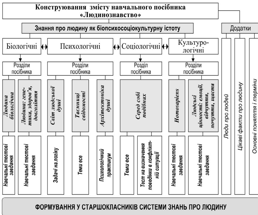
Рис. 2. Конструювання змісту навчального посібника «Людинознавство»

Для забезпечення реалізації процесу комплексного формування знань про людину в учнів старшої школи нами, окрім програми метакурсу «Людинознавство», було розроблено однойменний навчальний посібник (рис. 2). Посібник «Людинознавство» містить 45 тем (51 год), які об'єднані у вісім розділів. Перші два присвячено питанням виникнення і розвитку людини як частини природи, людини як представника біологічного виду. Погляди на генетику, здоров'я і довголіття викладено у третьому розділі. Передбачено, що за використання рефлексійно-пізнавальної технології навчальна інформація викликатиме рефлексію, розвиватиме гіпотетичне й образне мислення учнів.