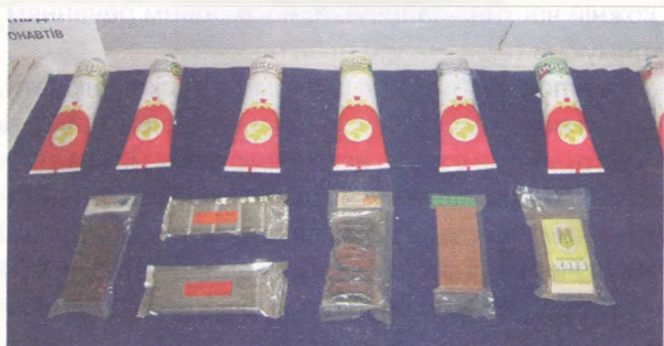
Харчові продукти для космонавтів.

(Фото В. Дем'яненка, експозиція Вороновицького музею історії авіації та космонавтики)