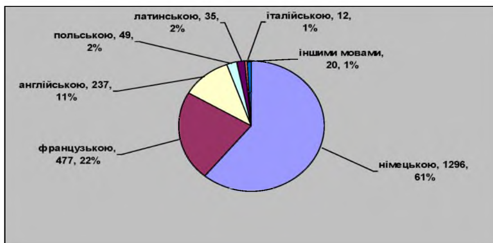
Діаграма 2. Мовний склад колекції

Проаналізувавши мовний склад колекції, виявлено що у ній зібрано документи, надруковані німецькою – 1296 (61%), французькою – 477 (22%), англійською – 237 (11%), польською – 49 (2%), латинською – 35 (2%), італійською – 12 (1%), іншими мовами – 20 (1%) (діаграма 2).