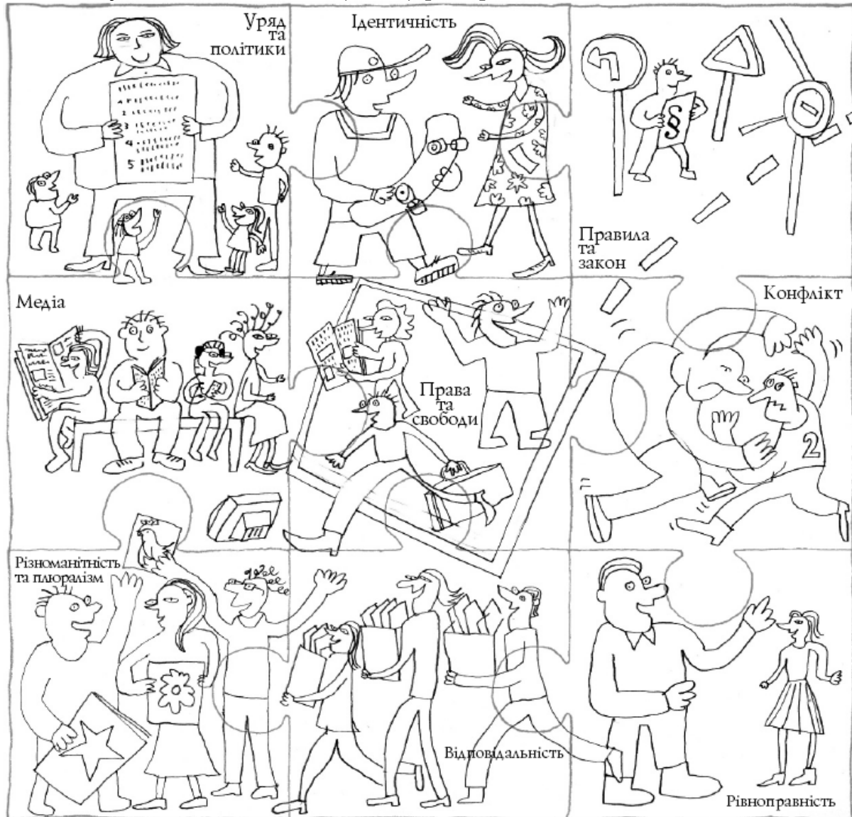
Рис. 2. Пазл-ілюстрація до серії посібників Ради Європи з питань освіти для демократичного громадянства. Автор - П. Віксман, 2009 р. [7,16].

Ключові поняття в рамках освіти для демократичного громадянства є категорією, яку виокремлено у наукових та навчально-методичних розробках спеціалістів Ради Європи. [7,13]. Особливу роль у викладанні ОДГ/ОПЛ відіграє візуалізація понять, що застосовуються через навчальні теми, ключові поняття тощо. Прикладом такої візуалізації є поданий нижче малюнок, через який спеціалісти з ОДГ Ради Європи передають взаємозв'язки між поняттями та їх поєднання у навчальних темах (Рис.2) [7,16].