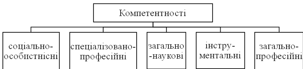
Рис. 2. Основні компетентності бакалаврів з комп'ютерної інженерії

Основні напрями професійної діяльності бакалаврів з комп'ютерної інженерії – організаційна, проектувальна, технологічна, дослідницька. Виробничі функції, якими повинні володіти бакалаври з комп'ютерної інженерії: дослідницька; організаційна; проектувальна, технологічна.