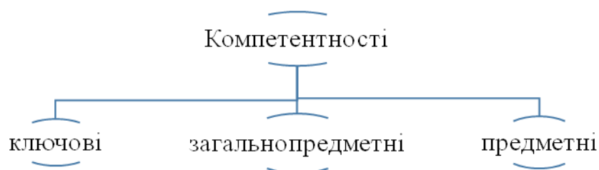
Рис. 1. Структура системи компетентностей в освіті

На думку С. А. Ракова, компетенція – еталон досвіду дій, знань, умінь, навичок, творчості, емоційно-ціннісної діяльності, який встановлює суспільство [6]. В ОКХ бакалаврів з комп'ютерної інженерії зазначається, що компетенція включає знання й розуміння, знання як діяти, знання як бути [5]. На рис. 1 показана структура системи компетентностей в освіті.